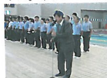
新美会長 激励のこぼ

例年、開催されている水泳記録会ですが、今年の競技参加者はなんと854名で大いに盛り上がった水泳記録会となりました。(昨年 709名)