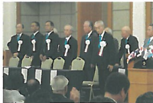
地区ガバナーをはじめ地区・2リジョン役員の皆様