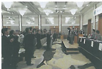
2リジョンクラブ全員での力強いライオンズローア