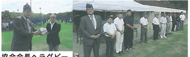
協会会長へラグビーボールの贈呈

今年度より新規アクティビティとなる本大会を、豊橋南ライオンズクラブが支援・協賛する運びとなり、本クラブが協賛しての第1回目が開催されました。晴天に恵まれ、午前9時からの開会式は協会会長の挨拶で始まり、新美会長挨拶、続いて協賛品として本クラブよりラグビーボール30個を贈呈いたしました。主催の豊橋ラグビーフットボール協会は昭和47年に発足され44年の歴史があります。ラグビーへの関心が高まる中、競技人口が増えることを期待したいものです。