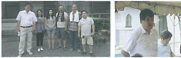
新美会長締め挨拶 ▼