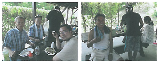
BBQを楽しむ会員のみなさま いい笑顔です