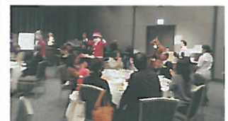
サンタとトナカイ入場