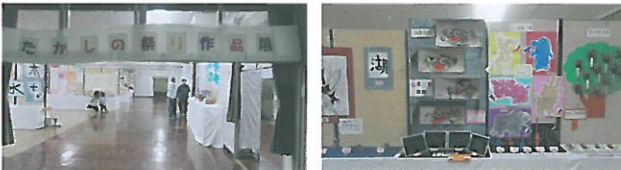
これより作品展示 スペース