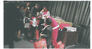
クリスマスプレゼントを喜ぶ子供たち