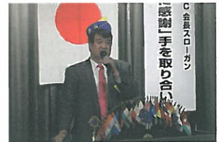
新美会長より激励の言葉