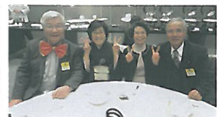
L船井・L森両ご夫妻(お合いの2カップル!)