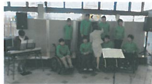
コーラスグループによる合唱