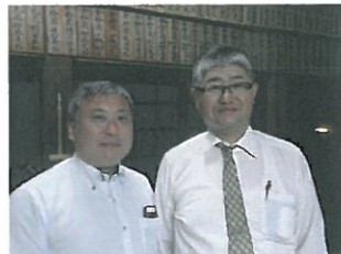
お疲れさまでした。 L判治 伸剛 L小野 真