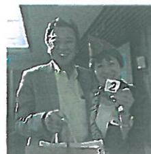
大活躍のテールツイスター