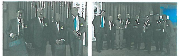
皆出席表彰された方々