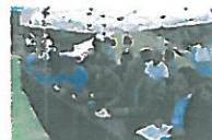
出席された当クラブメンバー