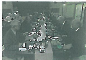
美味しい料理に舌鼓。お酒が進みます。