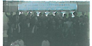
当クラブ集合写真(懇親会)