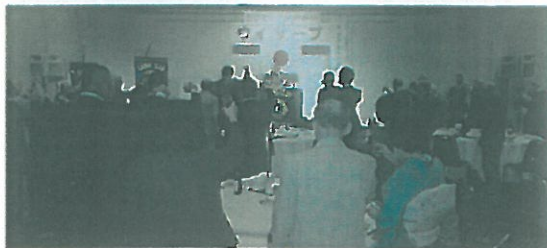
ウィサーブにて懇親会スタート