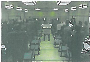
宴会乾杯にて宴会スタート