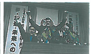
区切りのローアは会長・幹事で、力強く！