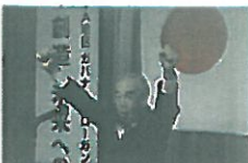
L荒木 義夫によるライオンズローアにて閉会