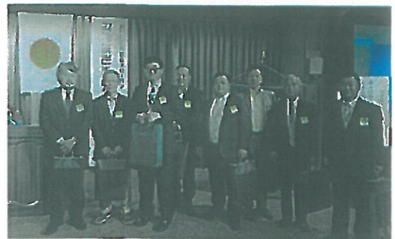
100周年記念会員増強賞表彰された方々